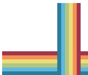
Hombres, Mujeres y Drogodependencias Explicación social de las diferencias de género en el consumo problemático de drogas

Un estudio realizado por FUNDACIÓN ATENEA